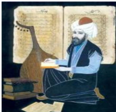
Рис. 1. Сафиэддин Урмави. Рис. Эльмиры Шахтахтинской.

один из знаменитых композиторов и музыковедов своего времени. Имя гремевшая в тяжелом и жестоком тринадцатом веке, смог сохраниться до наших дней, что считается удивительным фактом, учитывая, что многие великие достижения золотого периода исламской эпохи (VIII-XIII века) были подвергнуты огню и уничтожению. Его творчество считается вершиной всеобщего мусульманского искусства в области музыки прошлых эпох. Слава средневекового азербайджанского композитора не померкла несмотря на потрясения монгольских завоеваний. Яркость этой личности и многогранность его таланта были запечатлены во многих источниках, став причиной того, что память о нем дошла до будущих поколений. Сафиэддин Урмави родился в городе Урмия в 1216 году (по некоторым данным в 1217 году). Как ни странно, Сафиэддин Урмави в начале прославился в области каллиграфии. В ранние годы он отправляется в Багдад – в тот момент являвшимся центром всей мусульманской культуры и науки. В Багдаде за свой красивый подчёрк и талант каллиграфа Сафиэддин Урмави устраивается писарем лично в новопостроенной библиотеке халифа 1 .