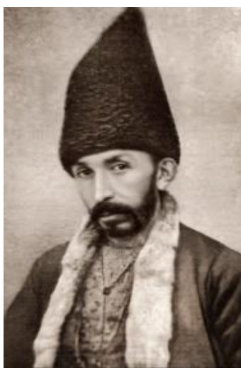
Рис. 4. Мир Мохсун Навваб

химических экспериментов и обустроил два телескопа для наблюдения за небесными телами. Ещё с молодых лет Навваб активно участвовал в культурной и общественной жизни Шуши. Кроме занятий живописью и педагогической деятельностью Мир Мохсун уделял внимание музыке, ставшим одним из любимых развлечений азербайджанцев. Он организовывал в Шуше самые громкие музыкальные меджлисы, вроде «Меджлиси-фарамушан» или «Меджлиси-Ханенде», на которых участвовали весь цвет местной аристократии и представители культуры из многих регионов Азербайджана. Талантливый шушинец также сочинял музыку и даже написал трактат, называемый «Вюзухул-эргам» («Наука о музыке») (рис. 5) и изданный в 1913 году 9 . В своем трактате Навваб уделял внимание мугаму, к тому моменту полностью покоривший Азербайджан. Впервые в национальном музыковедении шушинский интеллигент использовал термин «дясгях» 10 . Творчество Навваба оказало глубокое влияние на местную интеллигенцию, катализируя среди ее представителей новые новаторские идеи в мире музыки. Одним из ярких юных талантов кто попал под влияние Навваба был уроженец Карабаха, будущий основатель азербайджанской оперы – великий композитор Узеир Гаджибеков.