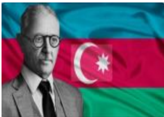
Рис. 6. Узеир Гаджибеков – автор музыки трех гимнов Азербайджана.

мира, особенно Запада и Америки. Узеир Гаджибеков на этом не останавливался. В следующем в 1909 году поставлена вторая опера Узеира «Шейх Санан». Затем было написано еще шесть опер и три оперетты – «Муж и жена», «Не так, так эта» и «Аршин мал алан», без которых национальную музыку Азербайджана невозможно представить. Последняя опера маэстро «Кероглы», считающаяся венцом творчества Гаджибекова, была написана в 1936 и поставлена впервые в 1937 в Баку. Опера «Кероглы» даже включена в репертуар московского Большого театра. Кроме опер и оперетт великий композитор написал приличное количество песен на азербайджанском языке и камерные инструментальные произведения. Помимо композиторской деятельности Узеир Гаджибеков занимался музыковедением. Великий композитор, так же как его предшественники Сафиэддин Урмави или Абдулгасир Марагаи писал трактаты по музыке, самым знаменитым которым был теоретический труд «Основы азербайджанской народной музыки» 12 . В этой работе главное внимание уделялось мугаму и особенностям национальной музыки Азербайджана конца 19 и начала 20 века. Узеир Гаджибеков также написал музыку к нескольким гимнам Азербайджана (1918 г, 1944г, 1993г) 13 , основал первую консерваторию и музыкальную школу, организовал оркестр азербайджанских народных инструментов и создал государственный хор.