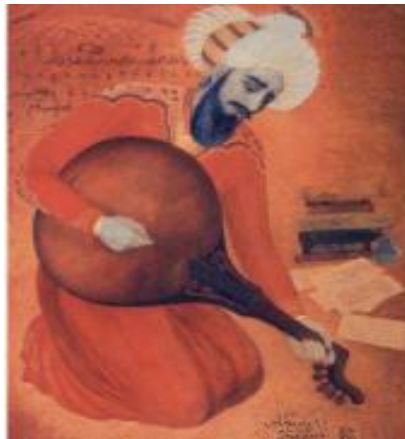
Рис. 2. Абдульгадир Марагаи.

Абдульгадир Марагаи жил и творил уже в период, когда монгольская завоевательная эпоха уходила с политической арены Востока. Абдульгадир Марагаи или же Абд аль-Кадир аль-Мараги (рис. 2) родился в городе Марага в 1353 году спустя 59 лет после смерти великого Урмави.