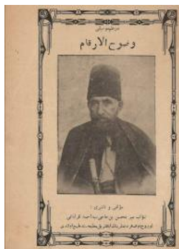
Рис. 5. Страница из трактата Навваба «Наука о музыке» с изображением самого автора.

Родившись в Агджабеди в 1885 году, Узеир Гаджибеков свои детство и юность провел в Шуше, снискавший славу «консерватории Кавказа». Юный Гаджибеков, к тому же обладавший большим талантом и тонким изысканным вкусом, пребывая в музыкальном царстве, где в разных сферах музыки творили такие яркие корифеи как Навваб, Садыгджан, Карягды, Сеид Шушинский, Хан Шушинский, Гурбан Пиримов и другие, был обречен в будущем на славу. Отец